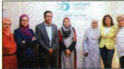
فريق عمل cairo seniors clinic

- مع تقدم العمر تحدث تغيرات في الجسم مما يجعل التعامل مع كبار السن طبيعة خاصة تراعى فيها جوانب عديدة مثل بعض الأمراض التي تصيب هذه الفئة العمرية وتزايد احتمالية التأثير بمضاعفات الأدوية. لذلك تزداد الحاجة إلى رعاية طبية متخصصة لضمان الوصول إلى أفضل النتائج... نحن فريق طبي متخصص في أمراض كبار السن، نقوم بعمل تقييم طبي شامل لنقف على المشكلات الواجب التعامل معها ونضع برنامجا خاصا بكل مريض يهتم في الأساس بالنتيجة الصحية ويتعدى ذلك ليشمل كل ما يهم الكبار من التواحي النفسية، سلامة الذاكرة والقدرة على ممارسة الأنشطة بشكل فعال. ● ما أهم المشاكل الصحية التي تصيب الكبار؟ - المشكلات الصحية التي تصيب الكبار هي: اضطرابات الذاكرة والاكتئاب