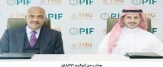
اجتماع من توقيع الاتفاق