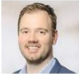
كاتبين - ياسمين كرام

وأضافت «سفلز مصر» أن العديد من الأسواق الإقليمية نجحت خلال العامين الماضيين في تعزيز جاذبيتها الاستثمارية عبر تطوير أطرها التنظيمية والحوكمة، مؤكدة أن مصر تمتلك المقومات اللازمة لمناقشة إقليميا بفضل حجم سوقها ومشروعاتها التنموية. إلا أن استكمال البنية التنظيمية يظل عاملا حاسما في جذب رؤوس الأموال المؤسسية وتعزيز استدامة النمو في القطاع العقاري.