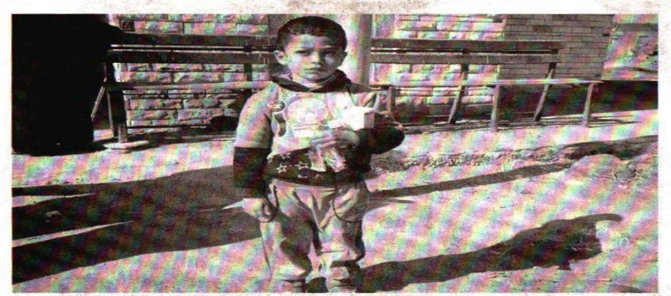
طفل يحتضن بعض الادوية امام وحدة الديبة إحدى قرى غرب بورسعيد

وضا كفرالشيخ، شهدت الصيدليات ارتباكا ورحاما شديدا من المواطنين لشراء الأدوية، ولجا مسؤولو عدد من الصيدليات إلى إخفائها انتظارا للأسعار الجديدة، وقال الدكتور محمد فهمى، للأسعار الجديدة، وقال الدكتور محمد فهمى، سيشاركون في الإضراب الجزئي. وحمت تقابة الصيادلة في الدقهاية أعضاءها اليوم بدار الحكمة بالقاهرة، وقالت في بيان: «دعوة للحفاظ على مهنة الصيدلة ومنع الجور اليوم بدار الحكمة بالقاهرة، وقالت في بيان: مقدراتها في لحظة من اللحظات الحرجة في مقدراتها في لحظة من اللحظات الحرجة في متازيخ المهنة وفي محاولات غير مسبوقة لفرض مقدراتها في المصلود عموع الصيادلة، أمر واقع عليها يوضله جموع الصيادلة، ومن المسؤدة فرض وقي المنيا، واصل أعضاء مجلس نقابة الصيادلة، المحافظة للتأكيد على المشاركة في الإضراب الجزئي وواصلت جمع التوقيمات على إقرارات الجمعية العمومية بالإضراب الجزئي عن العمل من التاسعة صباحا حتى الثالثة مساء غدًا، وحررت اللجنة إقرارات على أصحاب