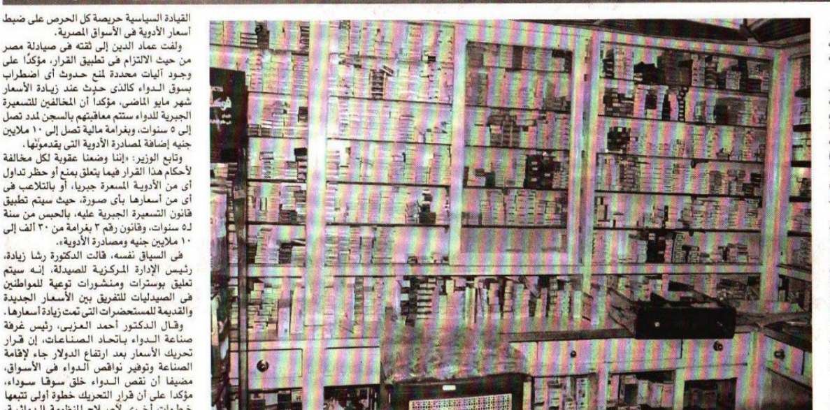
أزمة في سوق الدواء بعد تحريك الأسعار ، صورة أرشيفية ،

وأرجع الدكتور محمود فتوح المتحدث باس واربع الدنور المعود العديد من الأخطاء في شركات «التول»، وجود العديد من الأخطاء في قوائم الأدوية، لأنه قبل انعقاد مؤتمر الوزير بـ٤ ساعات كانت إدارة الصيدلة تسال بعض الشركات عن الأصناف التي سنتم زيادتها، وهذا يوضع أن الوزير كان يسابق الزمن لإصدار قرار زيادة ان الوزير كان يسابق الرمن لإصدار هرار زيادة الأسعار قبل إضراب الصيادلة، لأنه يدرك أن أى زيادة في الأسعار في صالح الصيادلة، وبالتالي جزء كبير مفهم سيرفض الإضراب، وهو ما ادى إلى الاستعجال، وبالتالي حدرث أخطاء. من جانبه، قال الدكتور أحمد عماد الدين، وزير