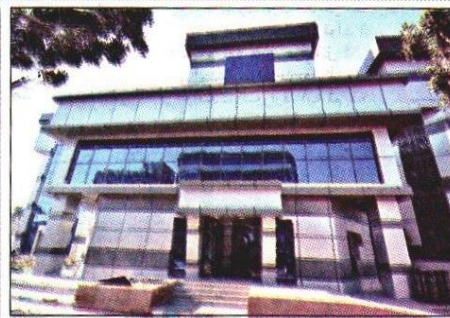
■ إحدى الوحدات الصحية ببورسعيد

من ناحية أخرى وافقت وزارة الصحة على اعتماد وتداول دواء جديد لعلاج سرطان الثدي المتقدم