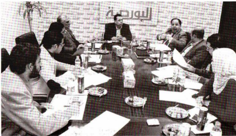
120 مليار جنيه حجم الإنفاق الصحي منها 52 ملياراً تمولها الخزنة العامة

«الصحّة» انتهت من إعداد مشروع القانون وتنتظر موافقة «الوزراء» لإحالةّه للبرلمان التشريع يستهدف إصلاح النظام الصحى وتشجيع القطاع الخاص على الاستثمار فيه