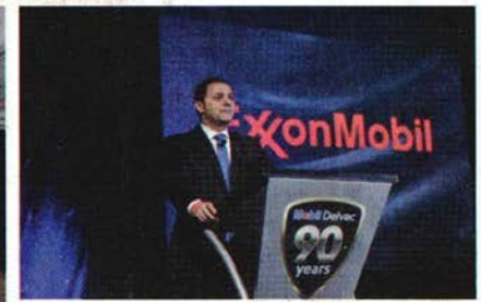
والدين مدير عام زبوت السيارات بشركة إكسون موبيل مصر

لي إطار تواصلها مع شركاء النجاح عقدت شركة إكسون موبيل مصر احتفالها السنوي مع متعهدي المخطات الذين تضافروا مع الشركة لتحقيق نجاح غير مسبوق خلال عام 2014. خلال الإحتفال أهدت إكسون موبيل مصر شركاء النجاح شهادات تقدير اعترافاً بمجهوداتهم في زيادة المبيعات وتنفيذ البرامج التسويقية للشركة على مدار العام الماضي.