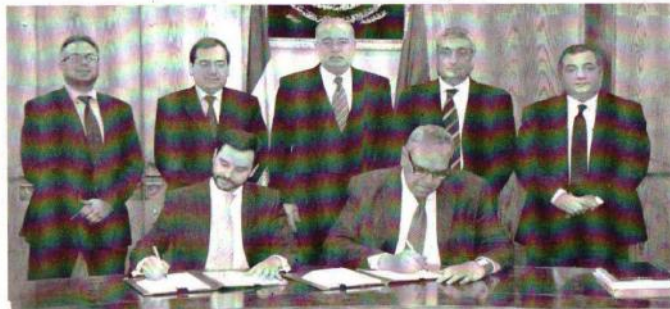
وزير البترول ووزراء الشركات أثناء توقيع الإتفاقية