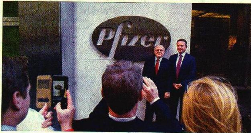
الرئيسان التنفيذيان لشركتي «فايزر» و«أليرجان» إيان ريد وبراينت ساوندرز يقفان أمام المصورين عند مدخل شركة «فايزر» في نيويورك أمس

بينما سيكون الرئيس التنفيذي لـ«أليرجان» براينت ساوندرز، مديراً للعمليات. (تفاصيل اقتصاد)