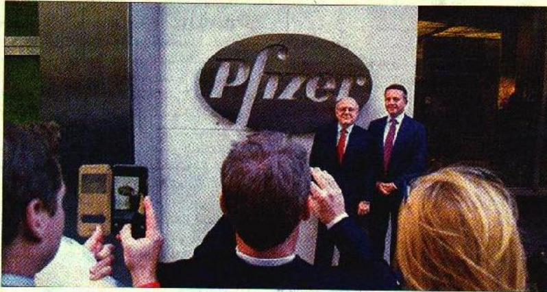
الرئيسان التنفيذيان لشركتي «فايزر» و«أليرجان» إيان ريد وبرت ساوندروز يقفان أمام المصورين عند مدخل شركة «فايزر» في نيويورك أمس

بينما سيكون الرئيس التنفيذي لـ«أليرجان» بريت ساوندروز، مديراً للعمليات (تفاصيل اقتصاد)