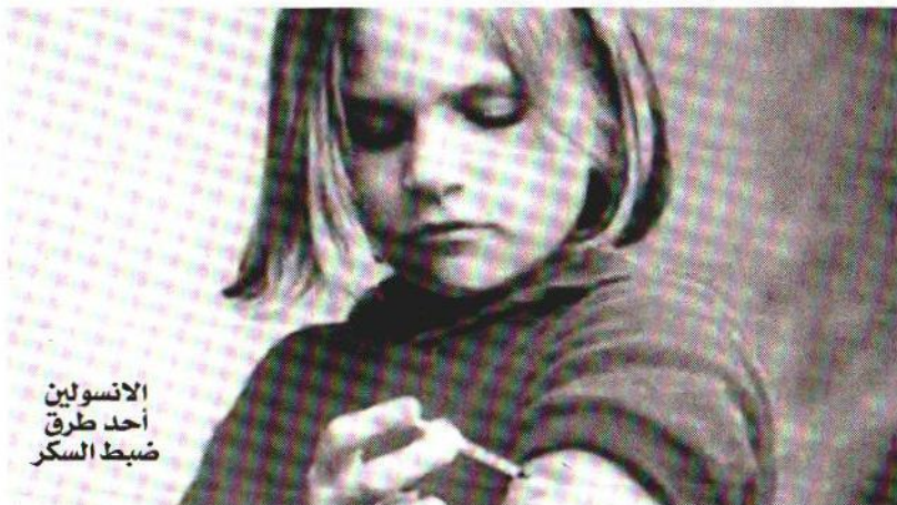
الانسولين أحد طرق ضبط السكر

الحديثة لعلاج مرضى السكر باختلاف ضبط مستوى السكر في الدم حسب حالة كل مريض فيكون الالتزام بالأرقام السابقة في المرضى صغار السن والذين تم تشخيص إصابتهم بالمرض حديثاً، وكذلك المرضى الذين لا يعانون من أي مضاعفات على القلب والأوعية الدموية، بينما ينصح المرضى كبار السن والذين يعانون من مضاعفات في القلب والأوعية الدموية بضبط مستوى السكر في مستويات أعلى تصل إلى ٧,٥ و ٨,٥ بالنسبة إلى الهيموجلوبين السكري وذلك لتجنب انخفاض مستوى السكر في الدم، ما قد تكون له مضاعفات شديدة على المريض، وفي النهاية أتمنى لمرضى السكر أن يتمكنوا من التحكم في مستوى السكر في الدم وتجنب حدوث أي مضاعفات للمرضى من خلال التزامهم بالنظام الغذائي السليم والمحافظة على وزنهم المثالي وممارسة التمارين الرياضية بانتظام والالتزام بالعلاج الدوائي الذي يقرره الطبيب.