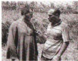
محرو السوق العربية يتحدث مع الفلاحين