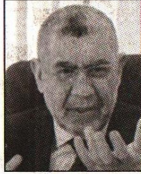
د. أحمد العزبى

أعلن أشرف سلمان وزير الاستثمار أنه سيتم طرح مشروعات لشركات قطاع الأعمال على مؤتمر القاهرة الاقتصادي في مارس القادم.